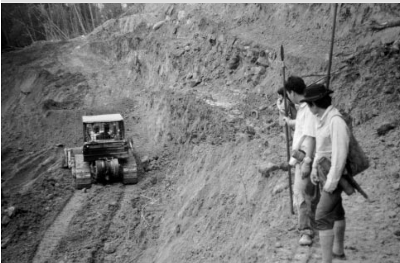
Waldvernichtung im Penan-Gebiet 1999