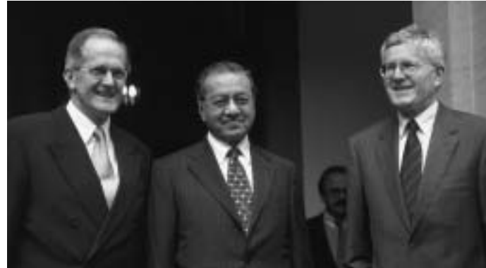
Das Beste aus beiden Ländern: Bundesräte Deiss und Villiger mit Premier Mahathir (mitte).

die Völker des Tropenwaldes unterstützt und gemeinsam mit ihnen Projekte realisiert.