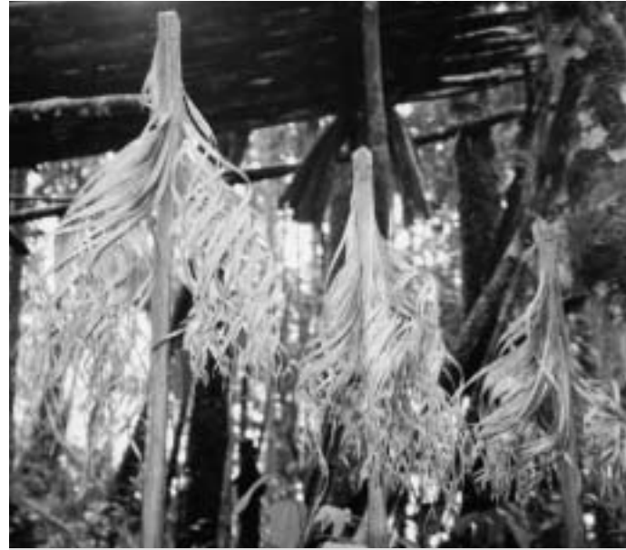
Lockenstöcke schützen vor Geistern – und vor der Gier der Ersten Welt?

Auch die Holzindustrie und die Exportländer haben mittlerweile das Problem erkannt. Ein Umstand, der die Internationale Tropenholzorganisation (ITTO)