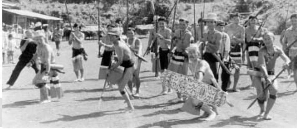
Traditionelle Eröffnung des Treffens in Long Sayan