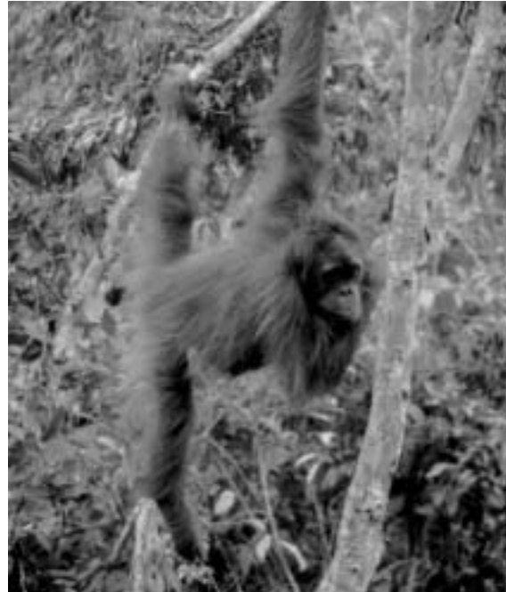
Der Lebensraum der Orang Utans auf Borneo und Sumatra wird den Wegwerfbedürfnissen der 1. Welt geopfert.

Hintertür des FSC-Labels Tropenholz wieder «salonfähig» wird. Greenpeace und BMF haben aber bei der obigen Definition von «urwaldfreundlich» einen vertretbaren Kompromiss gefunden, um den Urwäldern der Erde zur dringend notwendigen Aufmerksamkeit und zu einem besseren Schutz zu verhelfen. Eine erfolgreiche Zusammenarbeit mit Greenpeace ist auf dieser Basis bereits beim «UrwaldbotschafterInnen-Test» für Kinder und Jugendliche zustande gekommen (siehe: http://www.greenpeace.ch/kids-for-forests/php/index.html )