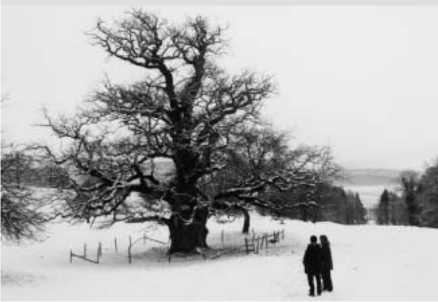
Bruno vor der winterlichen Chêne des Bosses, Januar 1999

Das als Wanderausstellung konzipierte Material steht Interessierten gegen eine kleine Gebühr zur Verfügung für weitere Ausstellungsorte.