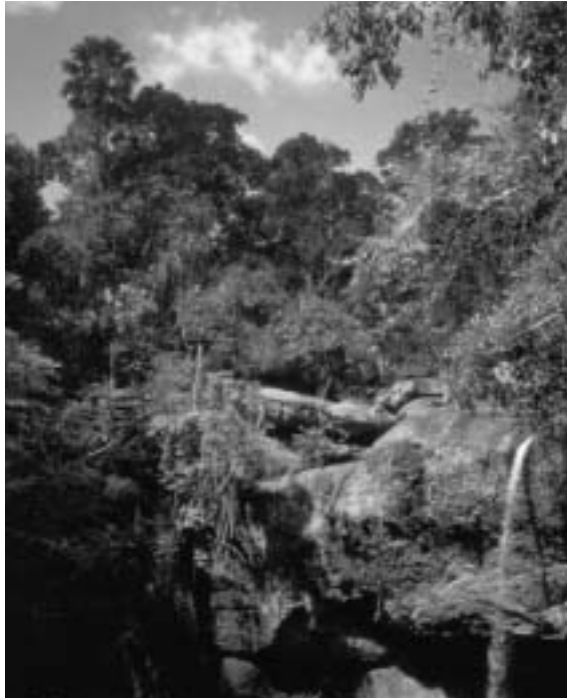
Im Kao Iai-Nationalpark; Thailand (1985).