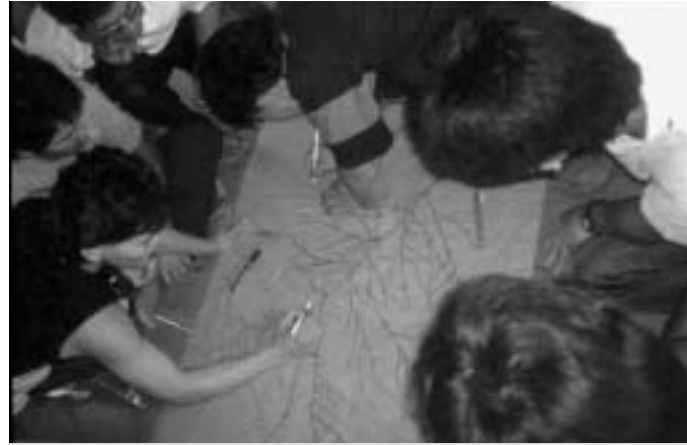
Aus dem Gedächtnis zeichnen die Penan eine erstaunlich exakte Karte ihres Territoriums.

Gemeinsam mit dem von den Penan gewählten Vertreter hat der BMF Anfang 2002 ein Projekt ausgearbeitet, das die Kartierung von 16 Siedlungen im Quellgebiet des Baramflusses sowie 8 Nomadenterritorien umfasst. Das Projekt wurde auf 650 000 Franken veranschlagt, was die Möglichkeiten des BMF übersteigt. Glücklicherweise stiessen wir bei der vom Basler Galeristen Ernst Beyeler im November 2001 gegründeten Stiftung «KUNST FÜR DEN TROPENWALD» auf Gehör und reichten per Ende Juni 2002 einen formellen Antrag zur Finanzierung dieses Projektes ein. Das Gesamtprojekt ist in 9 Phasen unterteilt, wobei Phase 1 (laufender Gerichtsfall der 4 Siedlungen) bereits Anfang 2002 begann und mittlerweile abgeschlossen ist. Phase 2 und 3 haben die Kartierung von drei weiteren