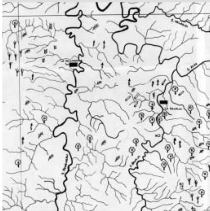
Danach werden mittels Kompass und Satellitentechnologie Sagohaine, Jagdgründe, Grabstätten und aufgegebene Hütten in die Karten eingetragen (Ausschnitt).

Der BMF bedankt sich im Namen der Penan und der ProjektpartnerInnen von Herzen bei Stiftungsgründer Ernst Beyeler und «KUNST FÜR DEN TROPENWALD»! (→ bald im Netz: www.kunstfuerdentropenwald.org )