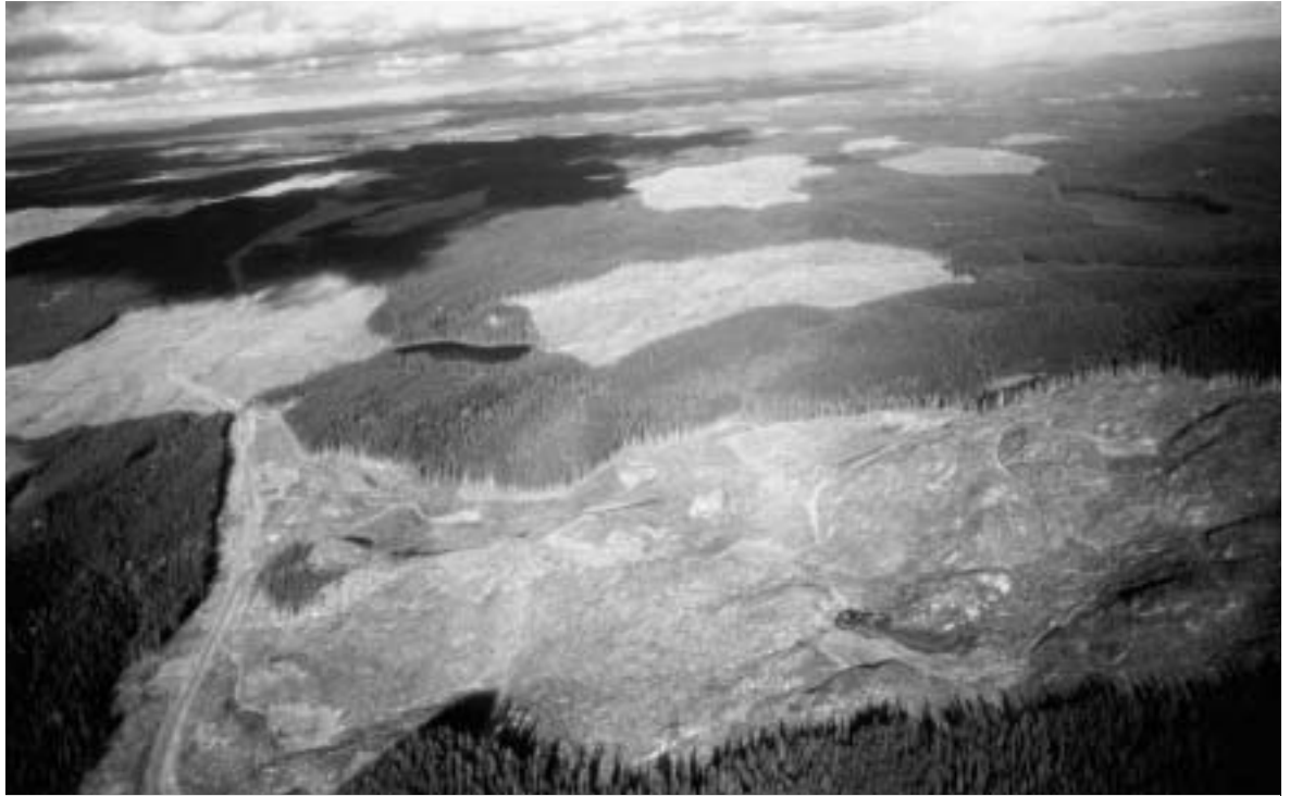
Kahlschlag in Kanada