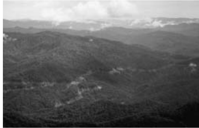
Seit Jahrzehnten macht Samling Co. den Penan das Leben am Baramfluss schwer.