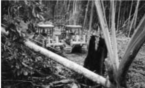
Mit Bulldozern gegen den Regenwald, mit Tränengas gegen die Penan. Samling kennt keine Rücksicht und ...