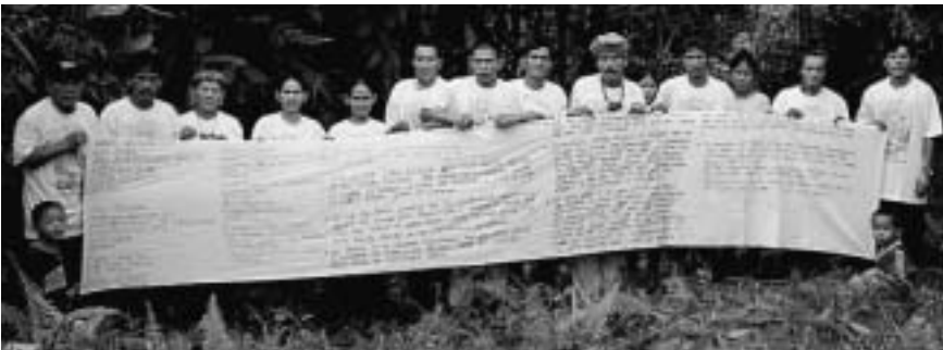
Die Penan vom oberen Baramgebiet wollen keine Holzindustrie auf ihren Territorien, auch wenn sie noch so «schonend» stattfindet. Ablehnung des Samling-Projektes «FOMISS» im Jahre 1999.