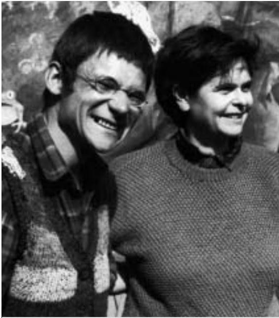
Bruno mit der frisch gewählten Bundesrätin Dreifuss; März 1993.

jk – Kaum im Amt strickte Ruth Dreifuss mit Bruno Manser Pullover auf dem Bärenplatz in Bern, auf dass es den Herren Magistraten warm ums Herz werde. Mut, Hartnäckigkeit und Stehvermögen waren es, die Bruno ausserordentlich schätzte an der Bundesrätin – Eigenschaften, die sicher auch in der wiedererlangten Freiheit erhalten bleiben! Der BMF gratuliert Frau Dreifuss zur geglückten Amtszeit und bedankt sich im Namen von Bruno Manser und den Völkern des Regenwaldes für die langjährige Unterstützung. Mögen Ihre Wünsche sich erfüllen – Sie haben es verdient!