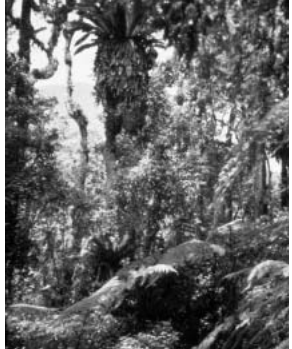
Primärwald im Ujung Kulon-Nationalpark, Java

In Städten und grösseren Gemeinden: Entweder einen Gemeindepolitiker für einen Vorstoss im Gemeinderat/-parlament gewinnen oder selber einen Brief an den Gemeinderat/Stadtrat schreiben; mit den Unterschriften von mehreren ortsansässigen Personen bekommt das Schreiben politisches Gewicht! Aufwändiger, aber Erfolg versprechender ist es zusammen mit einer politischen oder zivilen Gruppierung (z.B. Naturschutzverein) eine Petition an die Gemeinde zu lancieren und Unterschriften zu sammeln. Bei Einreichung der Petition die lokalen Medien informieren!