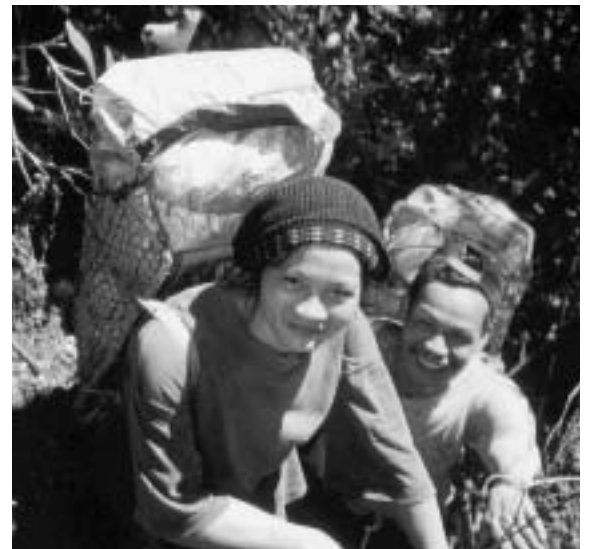
Penan-Paar unterwegs im Wald; Sarawak 2002

H. Thölen – Dem Leben Sinn geben. 120 Seiten (illustr.), Ott Verlag Thun (ISBN 3-7225-1143-2) CHF 29.80/EUR 17.50; erhältlich im Buchhandel