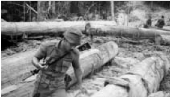
... kann auf die Hilfe von Polizei und Militär zählen, um den Widerstand der Penan zu brechen.

Warum stellen sich die Kenyah hinter die Regierung und Samling, obwohl ihnen klar jegliche Landrechte abgesprochen werden? Das ergibt nur dann einen Sinn, wenn man die Anträge als taktische List betrachtet, mit dem einzigen Ziel, den Prozess zu sabotieren.