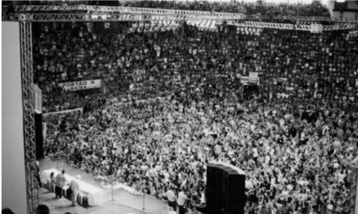
Riesiger Andrang für eine bessere Welt in Porto Alegre.