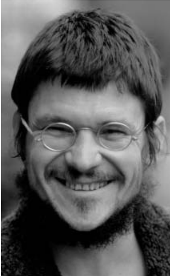
Seit 3 Jahren spurlos verschwunden: Bruno Manser, Menschenfreund und Umweltaktivist.