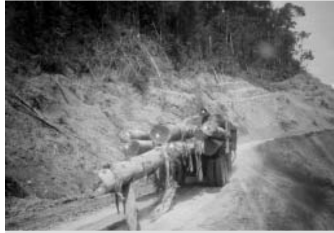
Nachhaltigkeit in Sarawak: «Weil es zu wenige Setzlinge gibt ...»

Dieses einschneidende Unterfangen wurde weitgehend unter Ausschluss der Öffentlichkeit vorangetrieben und soll am 1. April 2003 in Kraft treten. Damit gibt die Regierung praktisch die ganze Verantwortung ab!