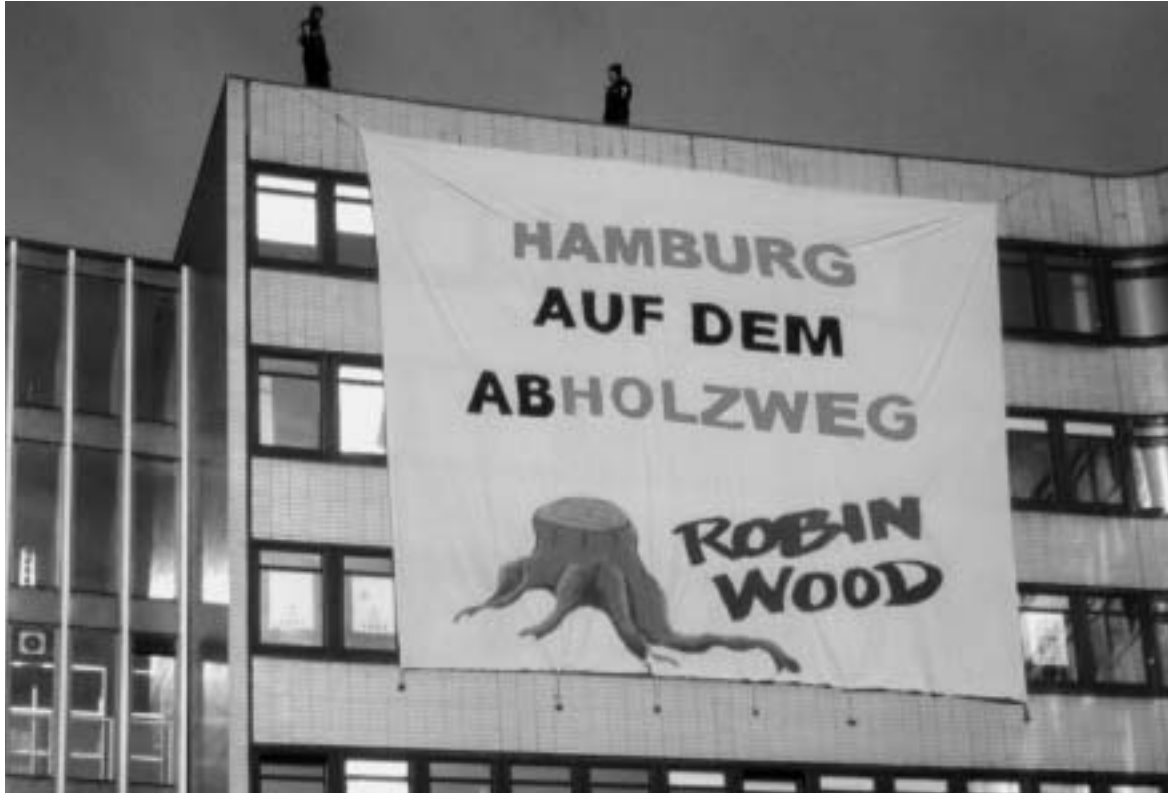
Waghalsiger Einsatz von Robin Wood für die Ureinwohner Malaysias am 13. Februar in Hamburg.