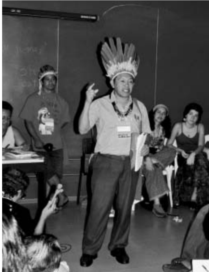
Nicht nur für die Holzhändler, auch für die vom Holzschlag Betroffenen trägt die ITTO Verantwortung...

Spendenkonto Schweiz/Liechtenstein: Postkonto 40-5899-8 Bank Coop, CH-4002 Basel, Konto 421329.29.00.00-5 Frankreich: La Poste, Strassburg, N° CCP 2.604.59T Deutschland: Deutsche Bank, Lörrach (BLZ 683 700 24) Konto 1678556; IBAN = DE85 6837 0024 0167855600 Satz und Druck: Gremper AG, Basel