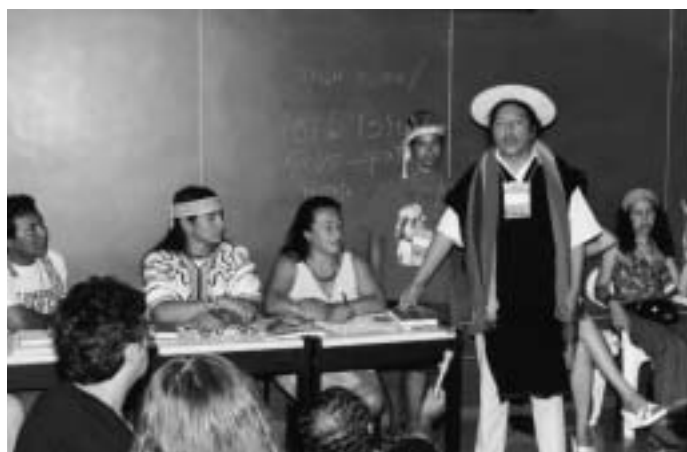
... Indigene Völker müssen angehört werden – so wie hier am Weltsozialforum in Porto Alegre!

wir gemeinsam mit der GfV aber auch, um die ITTO zur Einrichtung einer ständigen Beschwerdestelle für vom Holzschlag betroffene Bevölkerungsgruppen und Umweltorganisationen einzurichten. Denn es ist nicht einzusehen, warum die ITTO – eine eigentliche Lobby-Organisation der Produzenten, Händler und Verarbeiter – Beschwerden der Holzindustrie entgegennimmt, wenn diese z. B. nicht damit einverstanden ist, dass die Schweiz eine Deklarationspflicht für Holz und Holzprodukte einführen will, hingegen für die von der Holzindustrie verursachten sozialen und ökologischen Missstände kein Gehör hat.