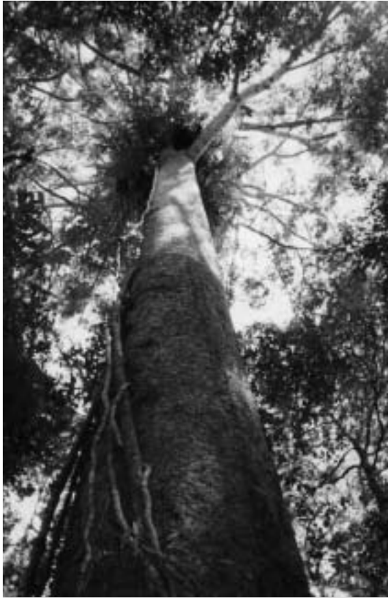
Mögen die Bäume weiterhin in den Himmel wachsen – auch für die Penan! Baumriese im Ulu Limbang, Juni 2002.