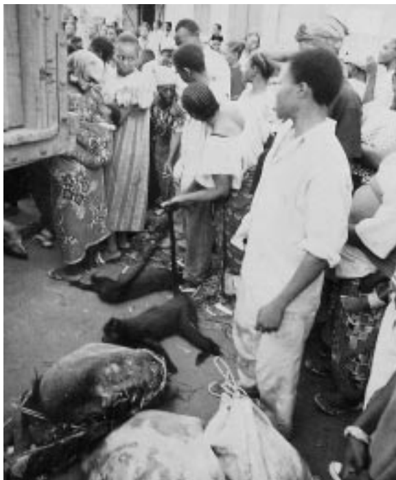
Die holzwirtschaftliche Erschliessung der Regenwälder in Zentralafrika öffnet den Wilderern alle Tore.

Die Firma Timbermaster Industries Bhd hat in Gabun eine weitere 10 000-Quadratkilometer-HolzkonzeSSION in einem Primärwald gekauft. Das Gebiet liegt am Okano-Fluss, direkt an der Grenze zur bereits bestehenden 2200-Quadratkilometer-Konzession. Jährlich sollen 300 000-Kubikmeter Holz eingeschlagen werden, insbesondere Okoumé und Ozigo. Die Firma beschäftigt 270 Arbeiter und hat 62 Bulldozer zur Verfügung. Pro