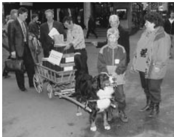
Der Berner Sennenhund, «Alex» transportiert die 2910 Couverts auf ökologische Art und Weise zur Berner Schanzenpost.