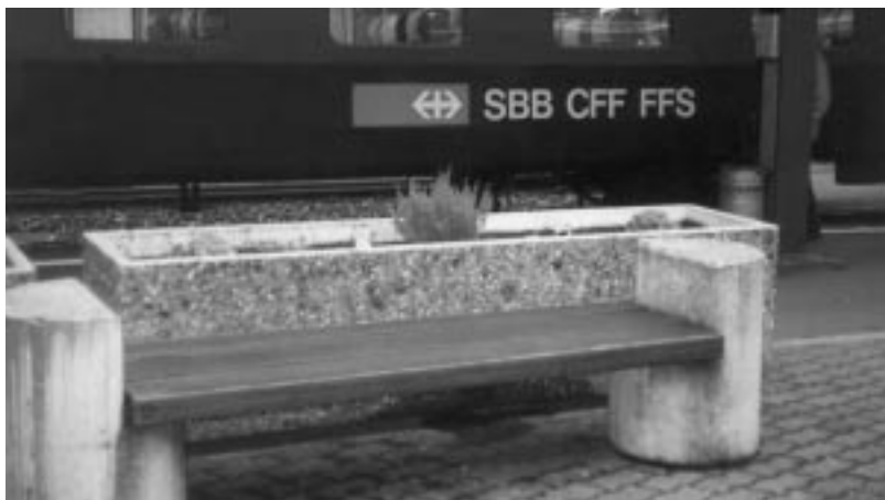
Tropenholzsitzbänke im Bahnhof Arth-Goldau.

Der Schweizer Waldwirtschaftsverband hat am 14. Oktober 1997, übrigens nur zwei Tage vor der Gründung der WWF Wood Group (siehe Rubrik «Bravo!»), sein eigenes «Öko-Label» für Schweizer Holz lanciert. Das sogenannte «Q-Label Swiss Quality» soll für die Einhaltung der Bestimmungen im Schweizer Waldgesetz bürgen. Ziel sei der flächendeckende Einbezug der ganzen Schweiz. Damit ist das «Q-Label» nicht mehr als eine freiwillige Herkunftsbezeichnung und entlarvt sich als billige Verhinderungsstrategie. Die Bemühungen der Umweltverbände für eine Zertifizierung der Schweizer Wälder nach den strengeren FSC-Kriterien sollen mit diesem Waldwirtschafts-Label vorzeitig torpediert werden.