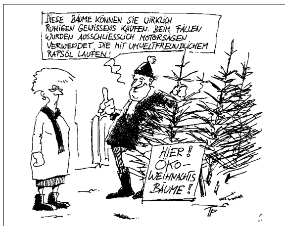
Karikatur: TAZ, 17. Dezember 1996

Seit unserem letzten Rundbrief vom September 1997 haben wir von den Gemeinden Feldis/Veulden GR, Gossau ZH, Lugaggia TI und Lutzenberg AR die Meldung erhalten, dass in kommunalen Bauten auf Tropenholz verzichtet wird. In Frankreich verzichten die Stadt Lille und die Region Nord Pas-de-Calais auf Tropenholz. Die Stadt Bordeaux hat sich für den Bau einer Promenade entlang der Garonne für Tannenholz an Stelle von Tropenholz entschieden.