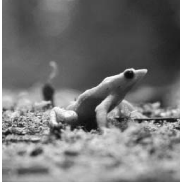
Grenouille (Atelopus oxyrhynchus) endémique des forêts pluviales montagnardes des Andes vénézuéliennes

A Genève, l'administration dans son ensemble a opté pour une meilleure gestion des ressources et la valorisation systématique des déchets dans le cadre du programme Ecologie au travail. Pour lancer cette démarche, neuf ateliers ont été créés, représentant tous les domaines d'activités de l'Etat: bureaux, cafétérias, écoles et université, laboratoires, hôpitaux, construction, nettoyage, garages et ateliers mécaniques. Une septantaine de spécialistes, scientifiques et hommes de terrain de chaque domaine considéré, œuvrent pour établir les directives internes du parfait «écologiste au travail». Une fois acceptées par le Conseil d'Etat, les directives sont mises en œuvre au sein de l'administration. Chaque collaborateur en est informé grâce à un programme de sensibilisation adapté.