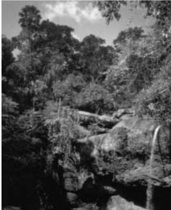
Dans le PN de Kao Yai en Thaïlande (1985)