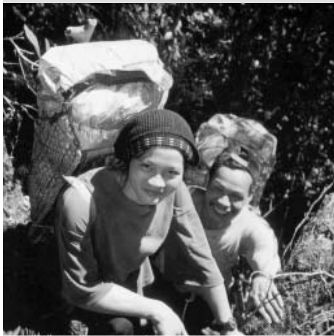
Couple Penan en route dans la forêt; Sarawak 2002.