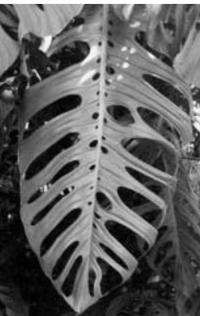
Feuille d'une Aracée (Monstera friedrichsthali) d'Amérique Centrale

Jusqu'à début décembre 2002, 31 nouvelles communes ont signé la déclaration d'engagement du BMF et de Greenpeace. Il existe donc maintenant au total 327 «communes amies des forêts anciennes» (voir liste en page 8). En février 2003, toutes recevront une distinction attestant de cet engagement.