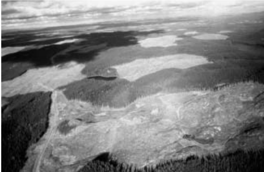
Coupe rase au Canada