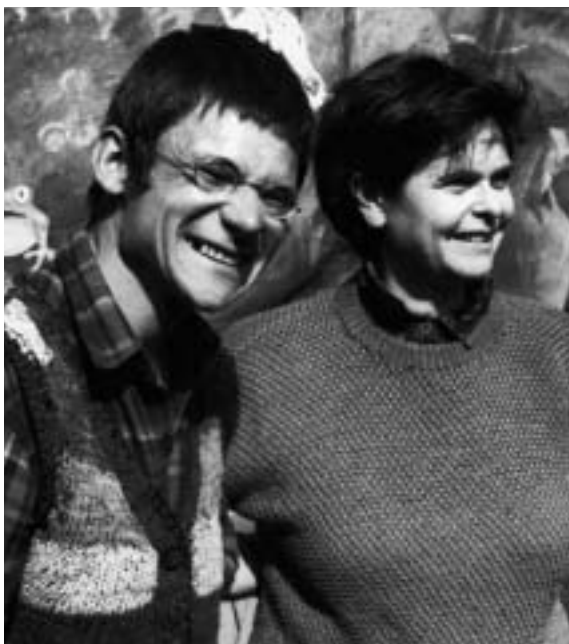
Bruno et Ruth Dreifuss, la conseillère fédérale récemment élue; mars 1993.

jk – A peine entrée en fonction, Ruth Dreifuss a tricoté des pulls en compagnie de Bruno Manser sur le Bärenplatz à Berne, afin que ces messieurs les magistrats «aient chaud au cœur». Bruno a beaucoup apprécié le courage, l’opiniâtreté et l’endurance de la conseillère fédérale. Ces qualités, notre ministre saura certainement les faire fructifier une fois la liberté retrouvée. Le BMF félicite Ruth Dreifuss pour l’accomplissement de sa tâche. Au nom de Bruno Manser et des peuples de la forêt pluviale, il la remercie de son fidèle soutien. Nous souhaitons que vos vœux se réalisent, vous l’avez bien mérité!