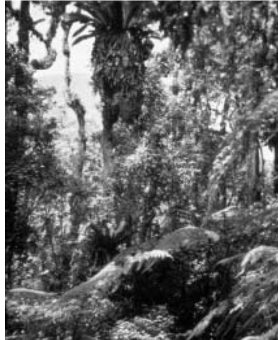
Forêt primaire dans le Parc National d'Ujung Kulon à Java (1985)

financiers. Intervenir par voie d'initiative personnelle s'il y a lieu (se renseigner sur les possibilités et les modalités).