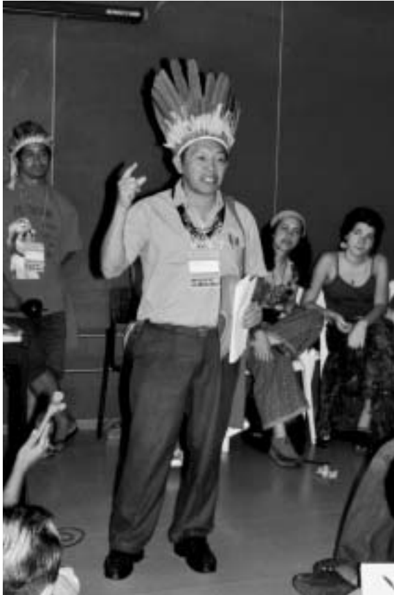
Pas seulement pour les marchands de bois, mais également pour ceux touchés par le déboisement, ...