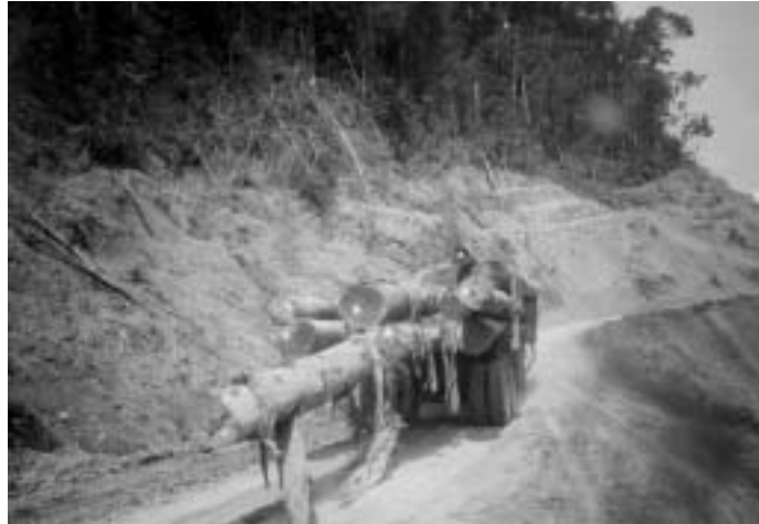
Développement durable au Sarawak: «Alors qu'il n'y a pas assez de jeunes plants...»

Aujourd'hui, près de 2000 de ses employés ont reçu une offre d'emploi dans un autre département ou une nouvelle firme. A l'avenir, le respect des dispositions légales sera assuré par moins d'une douzaine de fonctionnaires. Cette réforme radicale, menée en grande partie à l'insu du public, doit entrer en vigueur le 1 er avril 2003. Ainsi, le gouvernement se dégage pratiquement de toute responsabilité!