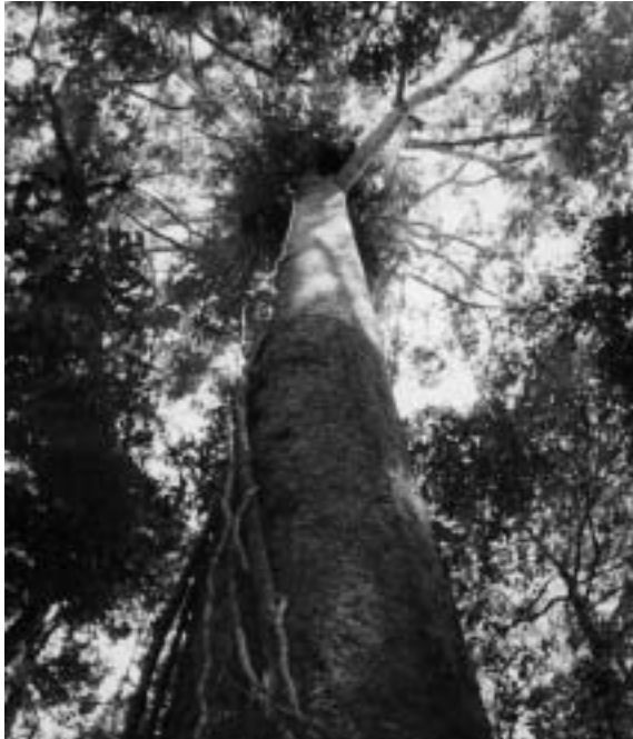
Pourvu que les arbres continuent à pousser jusqu'au ciel – aussi pour les Penan. Arbre géant dans le Ulu Limbang, Juin 2002