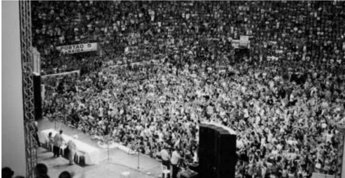
Rassemblement massif à Porto Alegre pour un monde meilleur.