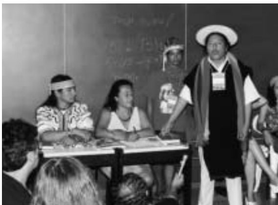
... la OIBT porte des responsabilités. Les peuples indigènes doivent être écoutés ...