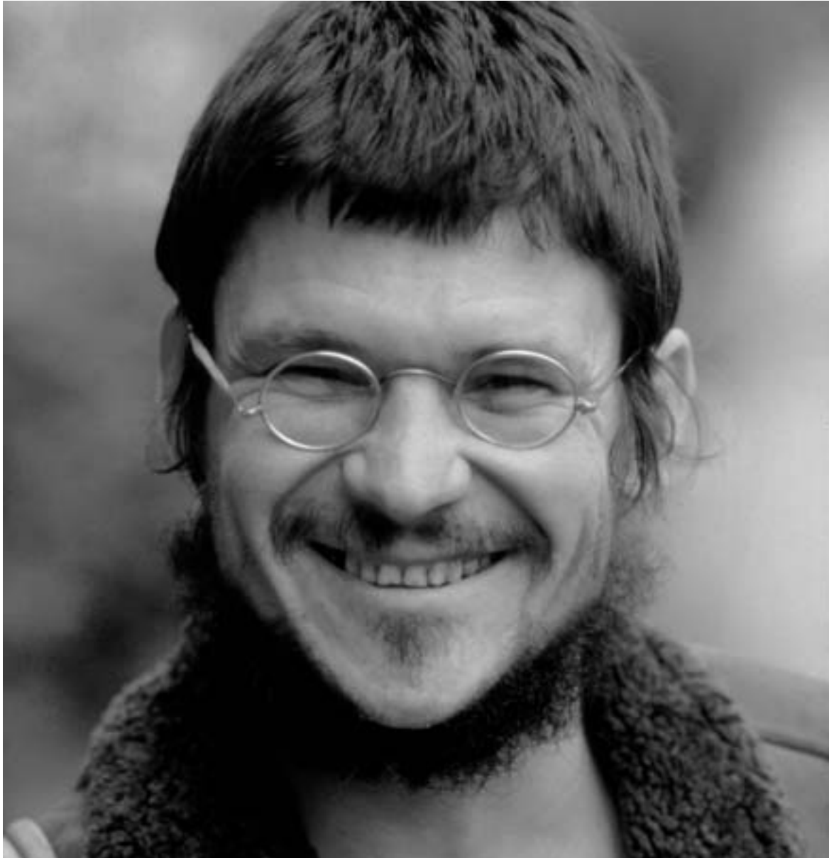
Disparu depuis 3 ans: Bruno Manser, philanthrope et écologiste.