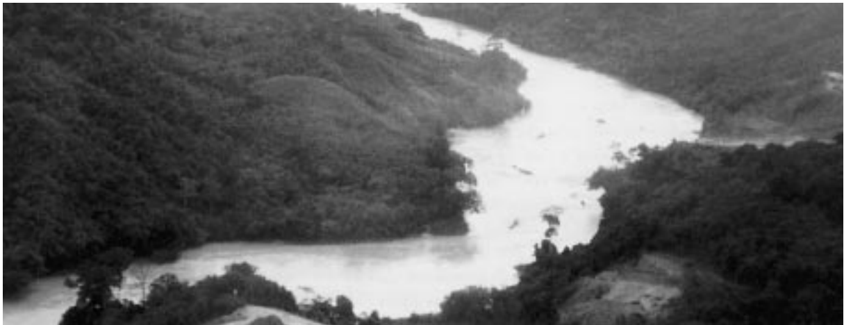
Emplacement de la retenue de Bakun avant la mise en eau.