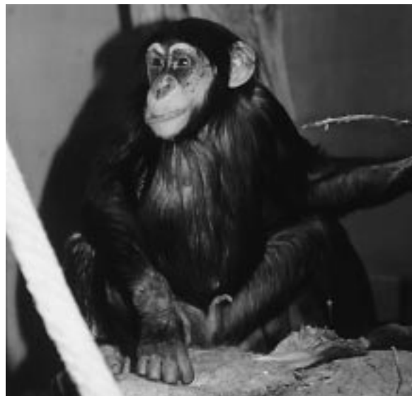
Chimpanzé d'Afrique occidentale ( Pan troglodytes verus )

Adresse: Mr. Joao de Deus Pinheiro, Commissioner for Development Cooperation, The European Commission, Rue de la Loi 200, B-1049 Bruxelles.