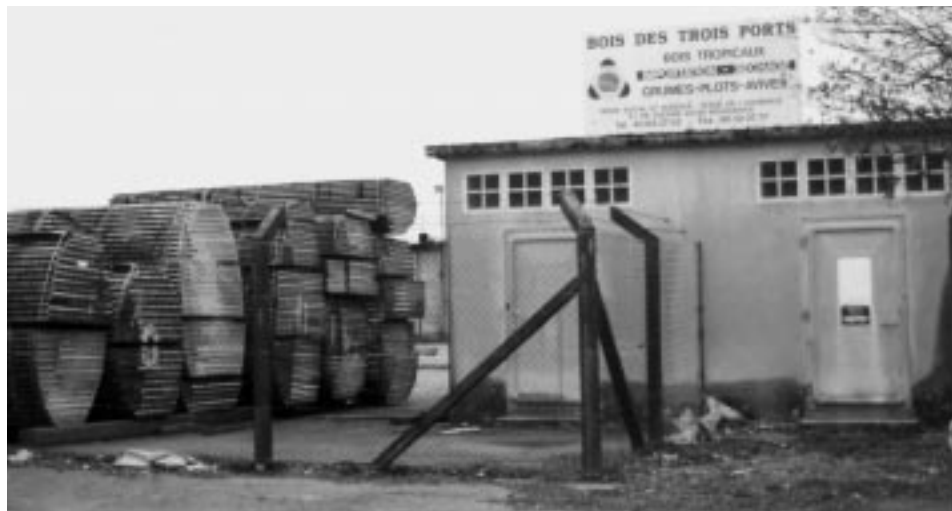
Nantes est un des plus grands ports de transbordement de bois tropical en Europe.

rg – Les importations de bois tropicaux en Suisse ont de nouveau augmenté en 1998 par rapport à 1997. C'est ce qui ressort des statistiques publiées par la «Schweizer Holz-Börse» du 18 février 1999. L'importation de bois rond (troncs entiers) a certes légèrement