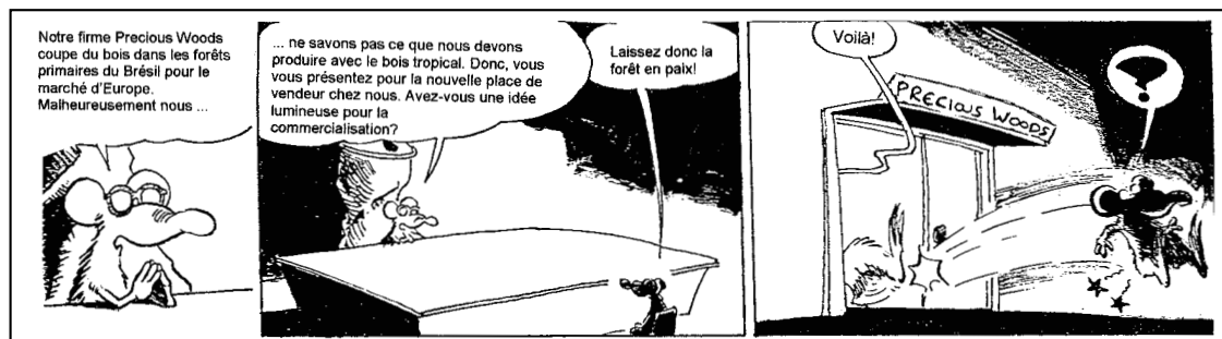
Caricature, texte de Roger Graf

L'importateur suisse de bois tropicaux «Precious Woods», dont nous avons déjà parlé à plusieurs reprises dans ce journal, cherche un «vendeur avec esprit d'initiative ayant des dispositions pour trouver des débouchés appropriés à ses produits spéciaux. Il devra vendre notre bois en Europe, spécialement en Allemagne et en Suisse.» Des baignoires, par exemple?