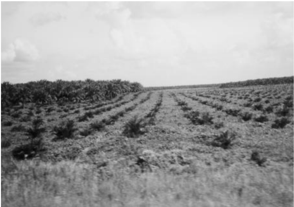
Plantation de palmiers oléagineux à Riau, Sumatra

D’autres Iban (de Rumah Riggie, Sungai Nat, Teru et Tinjar) sont opposés à la Nation Mark Sdn. Bhd., une société exploitant des plantations industrielles. Pour les débats judiciaires en cours à Miri, la BRIMAS a également préparé une carte des zones NCR..