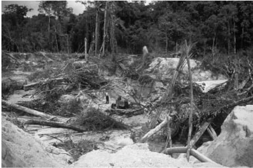
Garimpo dans la forêt pluviale brésilienne.