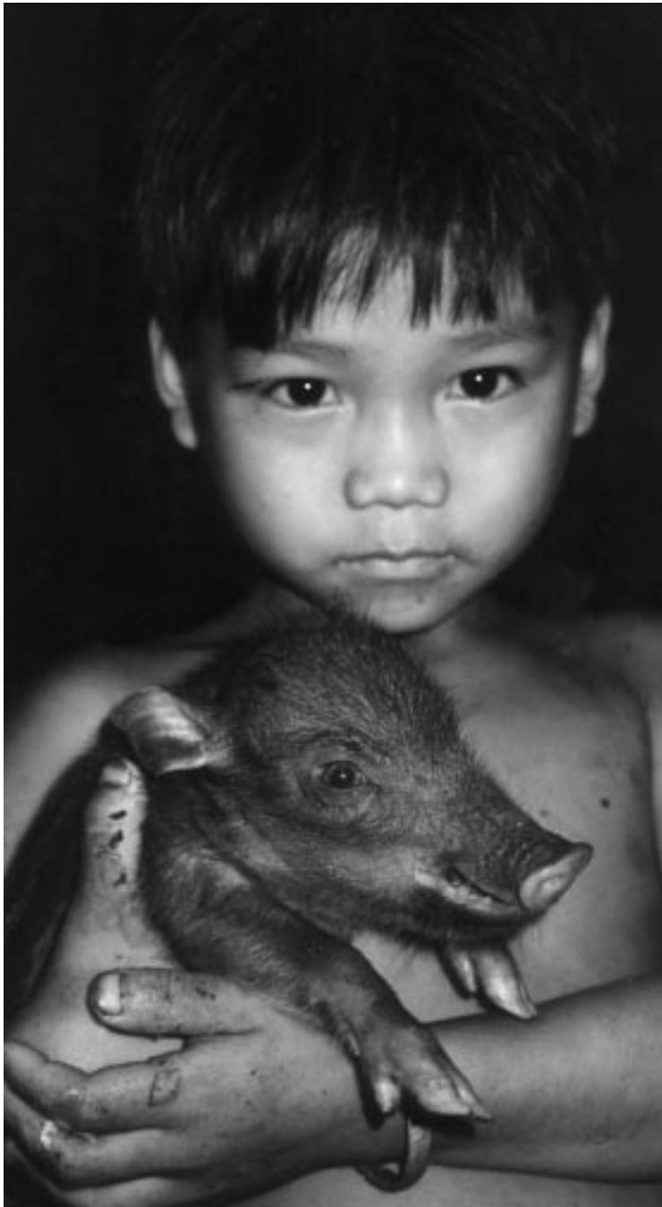
Juillet 1998