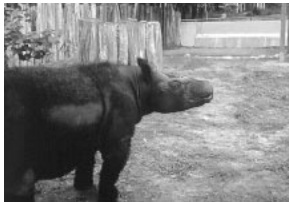
Rhinocéros de Sumatra dans le jardin zoologique de Melakka.